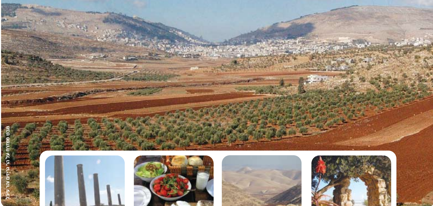
מבט ממזרח על הר היריזים והר עיבל