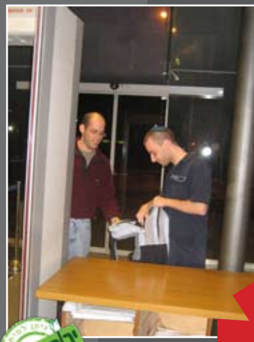
גליון 39 פרשת מקץ כ"ו כסלו תשע"א

תמונת שער: ויפתחו איש אמתחתו, ויחפש בגדול התל ובקטן כלה מקץ מ"ה, י"א-י"ב