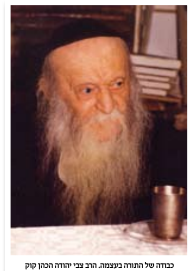
כבודה של התורה בעצמה. הרב צבי יהודה הכהן קוק

מרן הרב צבי יהודה הוציא לאור את רוב כתבי אביו בהלכה וגם בענייני אמונה. באחת מהערותיו בספר התשובות של אביו 'עזרת כהן', הוא עוסק בהלכה הדורשת מן העדים המופיעים בבית הדין לעמוד, שנאמר בתורה: 'ועמדו שני האנשים', אבל כאשר העד הוא תלמיד חכם מושיבין אותו. מסביר רש"י שאמנם קיימת מצוות עשה לעמוד, אך מצוות עשה של "את ה' א-לוקיך תירא - לרבות תלמידי חכמים" עדיפה.