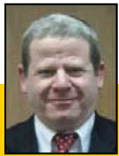
עוזר יונר מנכ"ל הרבנות הראשית לישראל

טלפון שמצלצל או רוטט בזמן התפילה מפריע למהלך התפילה, הן לאדם עצמו והן לסובבים אותו. כמעט בכל המקרים אין המדובר בפיקוח נפש או בנושאים שאינם יכולים להמתין עד לגמר התפילה. הדבר הנוון, החשוב והטבעי ביותר שאדם יכול לעשות לפני כניסתו לבית הכנסת הוא לכבות את מכשיר הטלפון לחלוטין ולהדליקו רק בתום התפילה. כאשר אדם מגיע לבית הכנסת, הוא צריך להתרכז כל כולו בתפילה ולהיות מחובר כל כולו לקב"ה. אי אפשר לחלק תשומת לב.